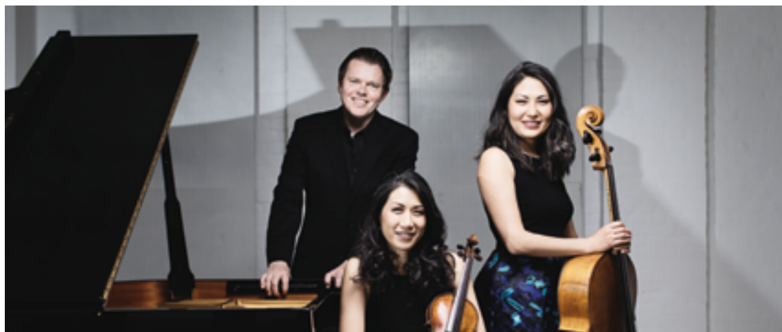
Verdenskendte Trio con Brio gæster Nødebo i marts

I kulturudvalget tror vi på, at vi fra slutningen af september igen kan mødes på Kroen og i fællesskab nyde koncerter og foredrag, som vi plejer. Og kulturkalenderen for sæson 2020-21 bliver større end nogensinde. Det skyldes, at de arrangementer vi måtte aflyse i marts og april er flyttet til efteråret, så det bliver et overflødigshorn af koncerter og foredrag i den kommende sæson.