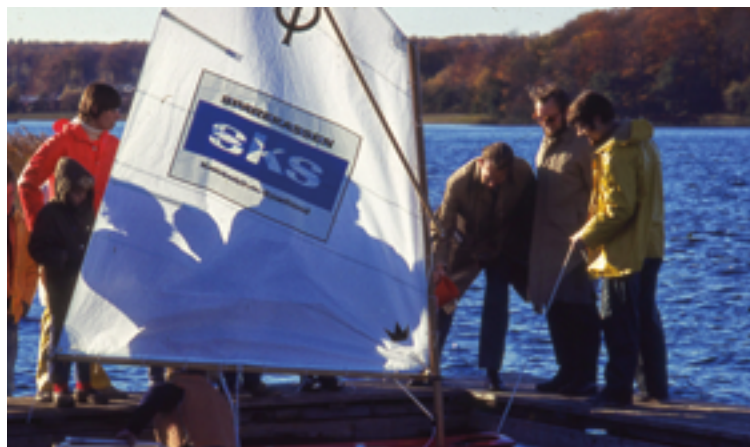
Optimistjolle doneret af SDS døbes den første sæson

Hillerød Sejlklub er en af de mange foreninger i Nødebo, og den har haft hjemsted på Krostien 11 siden midten af firserne. Men historien startede noget tidligere. I november 1970 blev der holdt stiftende generalforsamling på Kulsvierskolen i Hillerød, og i foråret 1971 blev standen hejst for første gang.