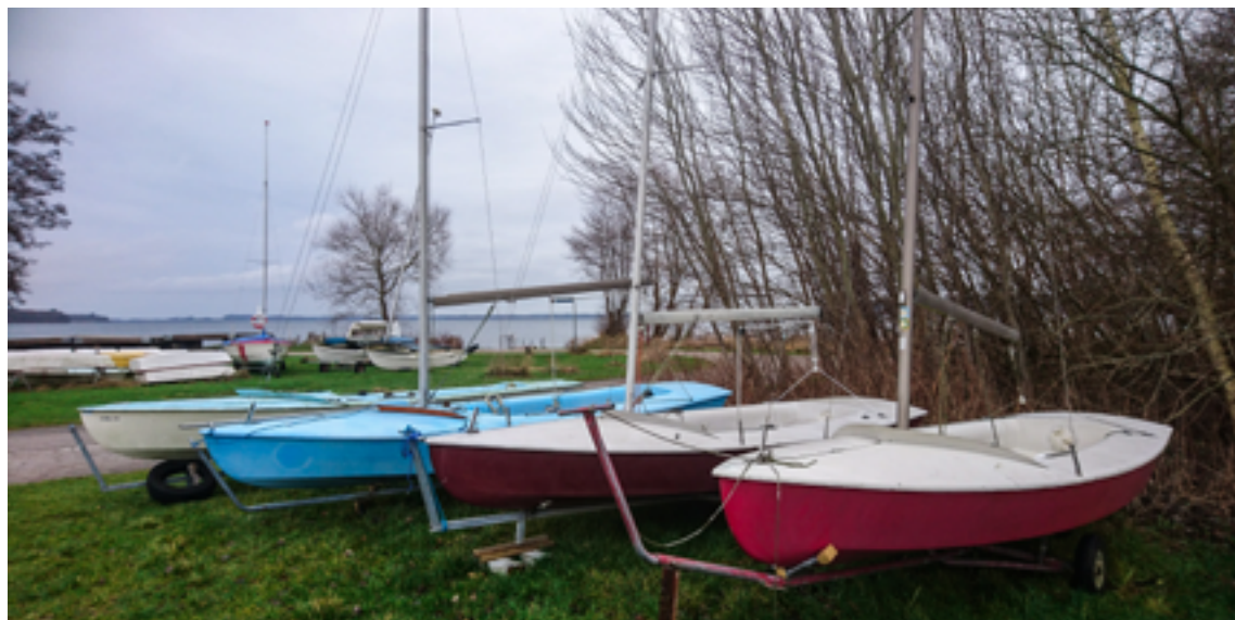
Snipejoller til familie og seniorsjilads

Familiesejlads på Esrum Sø - sport, motion og naturoplevelse