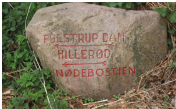
På pilgrimsruten til Hillerød

Turen, søndag d. 17. maj, er en vandretur med Danske Santiagopilgrimme, som går fra Esrum Kloster, ned langs