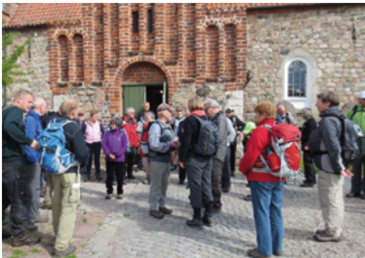
Pilgrimme mødes ved Nødebo Kirke