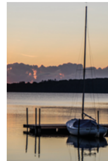
En smuk morgen ved søen