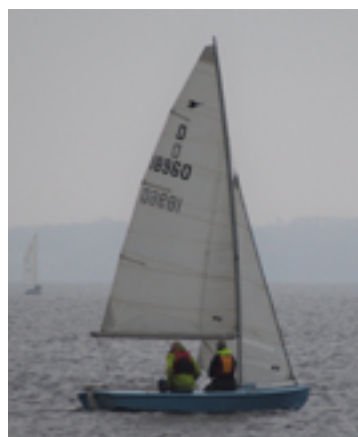
Snipejolle på søen en diset aften

Har du lyst til at være med i en lille hyggelig sejlklub og samtidig nyde den fantastiske Esrum Sø, så klik ind på vores hjemmeside og meld dig ind. www.hillerodsejl.dk .