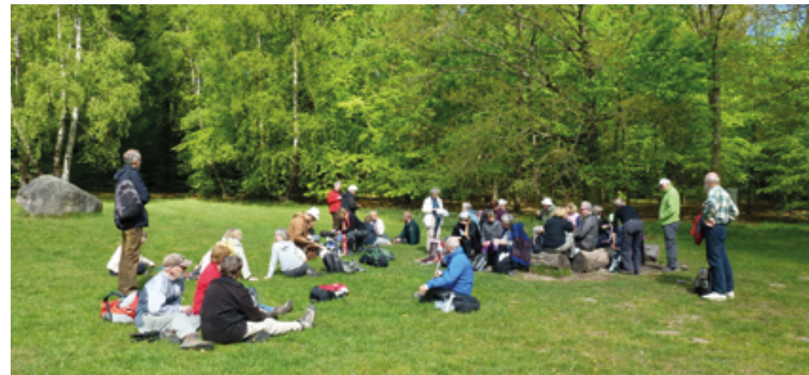
Pause ved Esrum Sø

Esrum Sø til Hillerød Station. I Gribskov udgør den markerede pilgrimsrute, en lille del af et kæmpe rutenet.