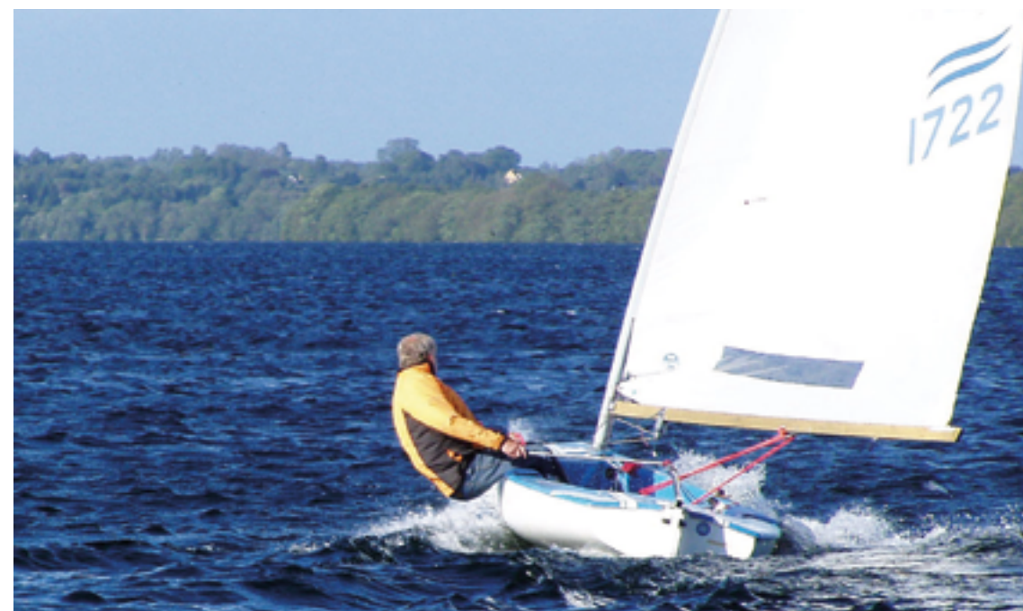
Finnjolle i god balance

I første omgang blev optimistjoller og laserjoller, som lå og forfaldt, sat i stand, så de var præsentable og