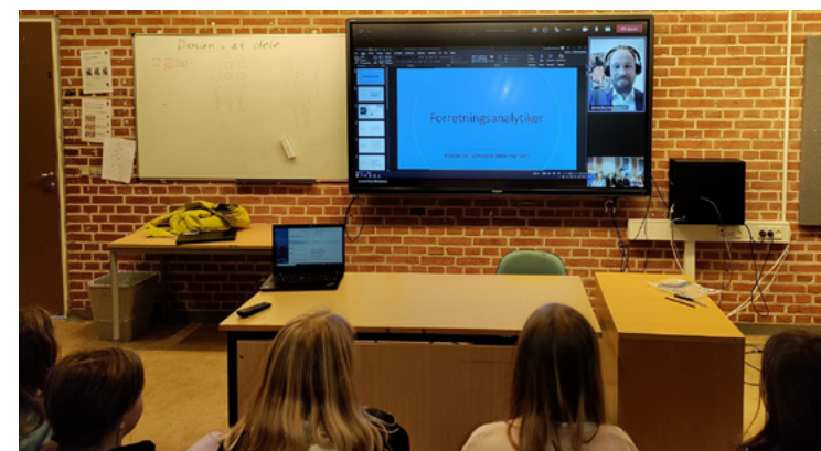
Besøg af forretningsanalytiker i forbindelse med "Uddannelse og job".