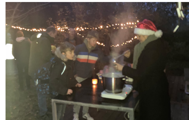
"Decembermorgen" er en hyggelig tradition på Nødebo Skole

I uge 6 er det de to timeløse fag "sundheds- og seksualundervisning og familiekundskab" og Uddannelse og Job" som er på programmet for alle skolens elever. I år har vi på Grønnevang Skole særlig fokus på familieformer og jobmesse. I denne uge skal alle klasser fra 2. klasse og op skal besøge Arbejdermuseet i København og i indskolingens skal klasserne også have besøg af forældre, der fortæller om deres uddannelse og job.