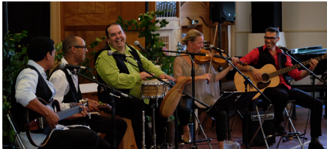
Latin Clasico gæster Kroen den 19. marts.

Nyt år og nye oplevelser. Året 2023 er kommet godt i gang med oplevelser på Kroen. Januar bød på klassisk koncert med Morgan Kvintetten, en festlig nytårsgallafest og fed rock med Billy Cross og hans venner. Der har været foredrag, jazz og folkemusik. Og det fortsætter de kommende måneder. Bl.a. er der jo MGP, som plejer at være en af de store dage på Kroen for hele familien arrangeret af aktivitetsudvalget.